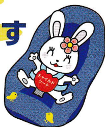
チャイルドシート着用推進シンボルマーク「カチャビヨン」